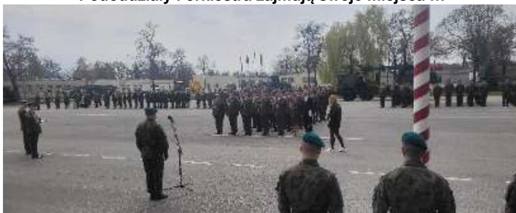
Wyróżniona Kadra i Słuchacze CSWiCh