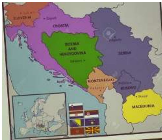
Główna uwaga była zwrócona na wnioski wynikające z rozpadu b. Jugosławii i wpływ bezpieczeństwa nie tylko na nowe powstałe państwa, ale i dla Europy