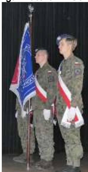
Poczet Sztandarowy – towarzyszył od początku do końca Sympozjum