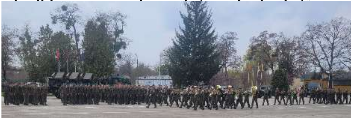
Pododdziały i orkiestra zajmują swoje miejsca ...

Po Sympozjum byliśmy zaproszeni na uroczystości związane ze świętem Wojsk Inżynieryjnych – na Plac Musztry – na którym przed laty uczyliśmy się „chodzić”!