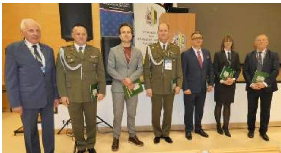
Wspólne zdjęcie. Organizatorów z Uczestnikami spotkania