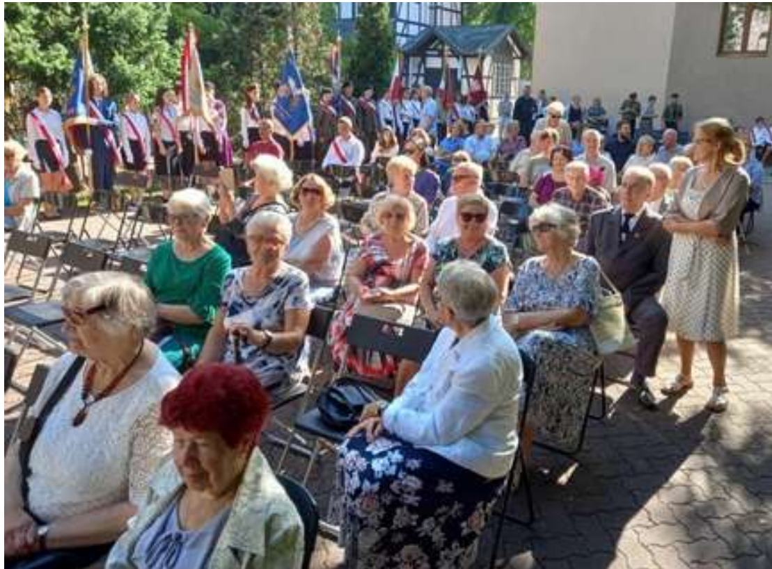
Panie z różnych organizacji kombatanckich zajmują miejsca