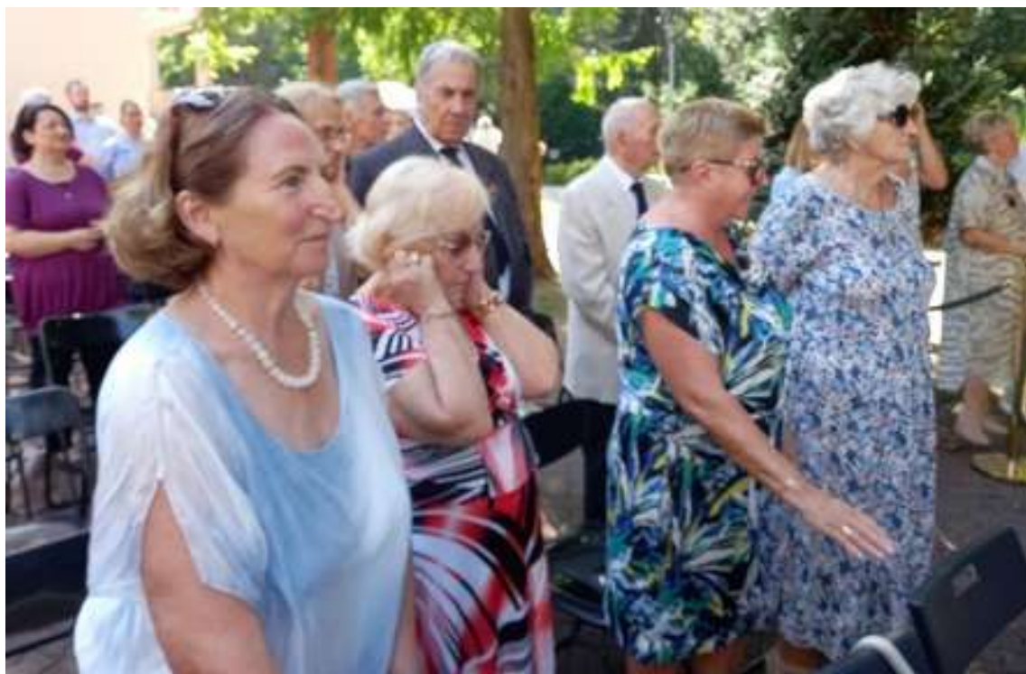
Po Apelu Pamięci – była salwa honorowa, która zawsze wywołuje emocje ...