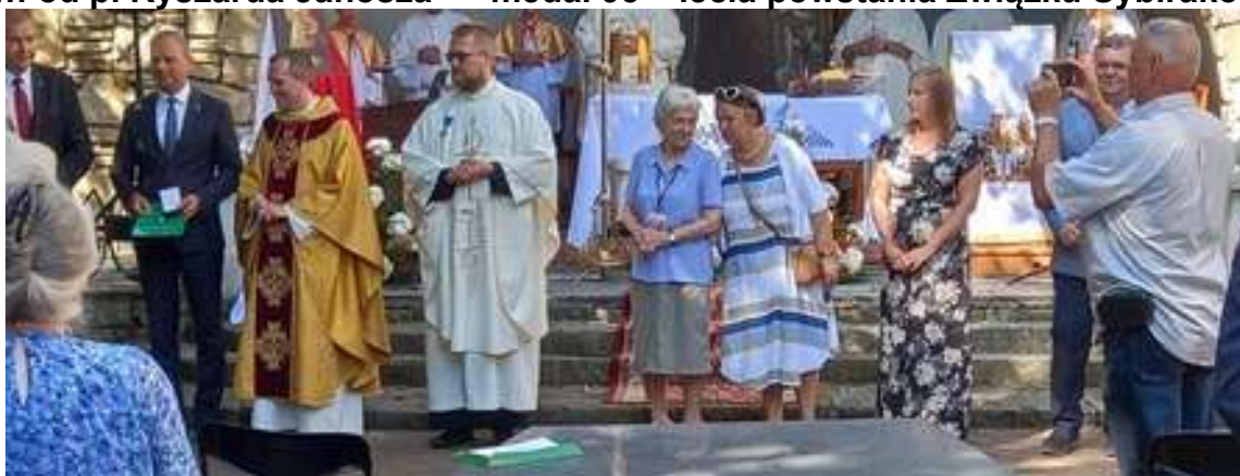
Osoby wyróżnione medalem 95 – lecia powstania Związku Sybiraków