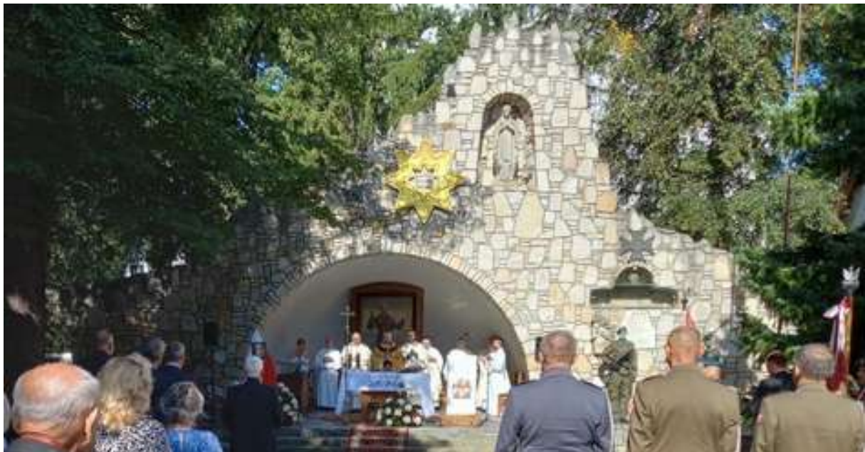
Mszę świętą czas zacząć ...