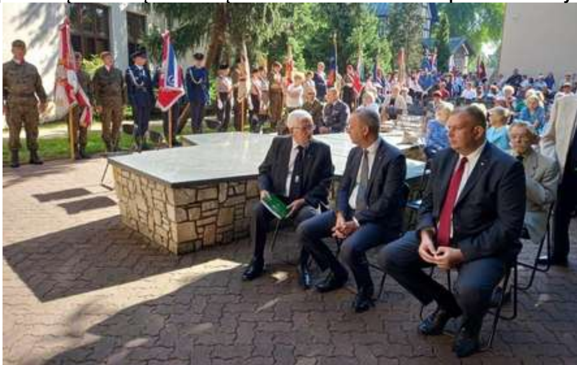
Tuż przed uroczystością – ostatnie ustalenia

Msza św. została odprawiona w intencji naszej Ojczyzny i ofiar napaści Niemiec i ZSRR na Polskę, od 01.09.1939r. W części patriotycznej, po przemówieniach osób reprezentujących, m. in.: Wojewodę Dolnośląskiego, Prezydenta Wrocławia i Oddziału Związku Sybiraków we Wrocławiu oraz wyróżnienia zasłużonych osób medalem 95-lecia powstania Związku Sybiraków – odbył się Apel Pamięci z salwą honorową oraz złożeniem kwiatów i zapaleniem zniczy.