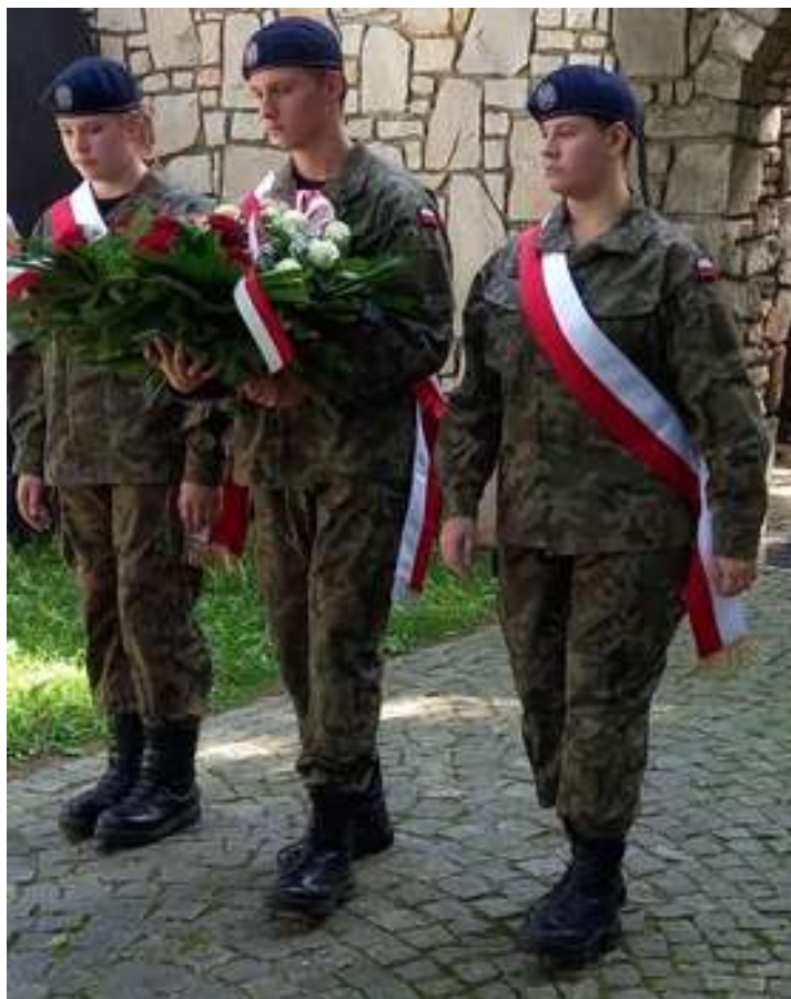
Wojsk Obrony Terytorialnej