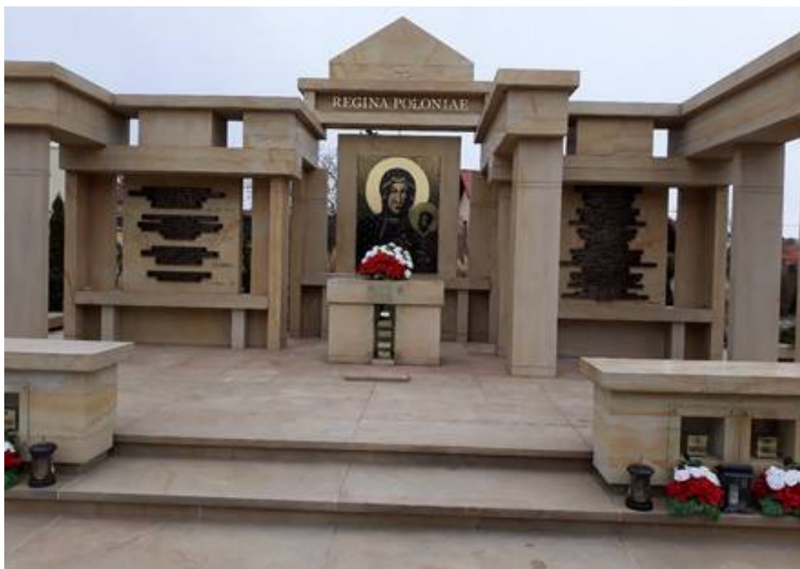
OŁTARZ MARKI BOŻEJ KRÓLOWEJ POLSKI w ZŁOTNIKACH Urny z ziemią upamiętniają miejsca walk: wojów, rycerzy i żołnierzy na wszystkich frontach walki. Tutaj jest urna także Sybiraków