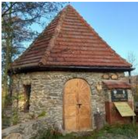
Kaplica Sybiraków w „Albertówce”

- budujemy pomniki /np. Pomnik Zesłańcom Sybiru/ i nadajemy /przy pomocy władz lokalnych/, tworzymy tablice pamiątkowe /w szkołach, kościołach, itp./ oraz nadajemy nazwy szkołom, ulicom, skwerom ze słowami, np. Zesłańcy, Sybiracy, itp. – które kojarzą się z zesłaniem lub deportacją.