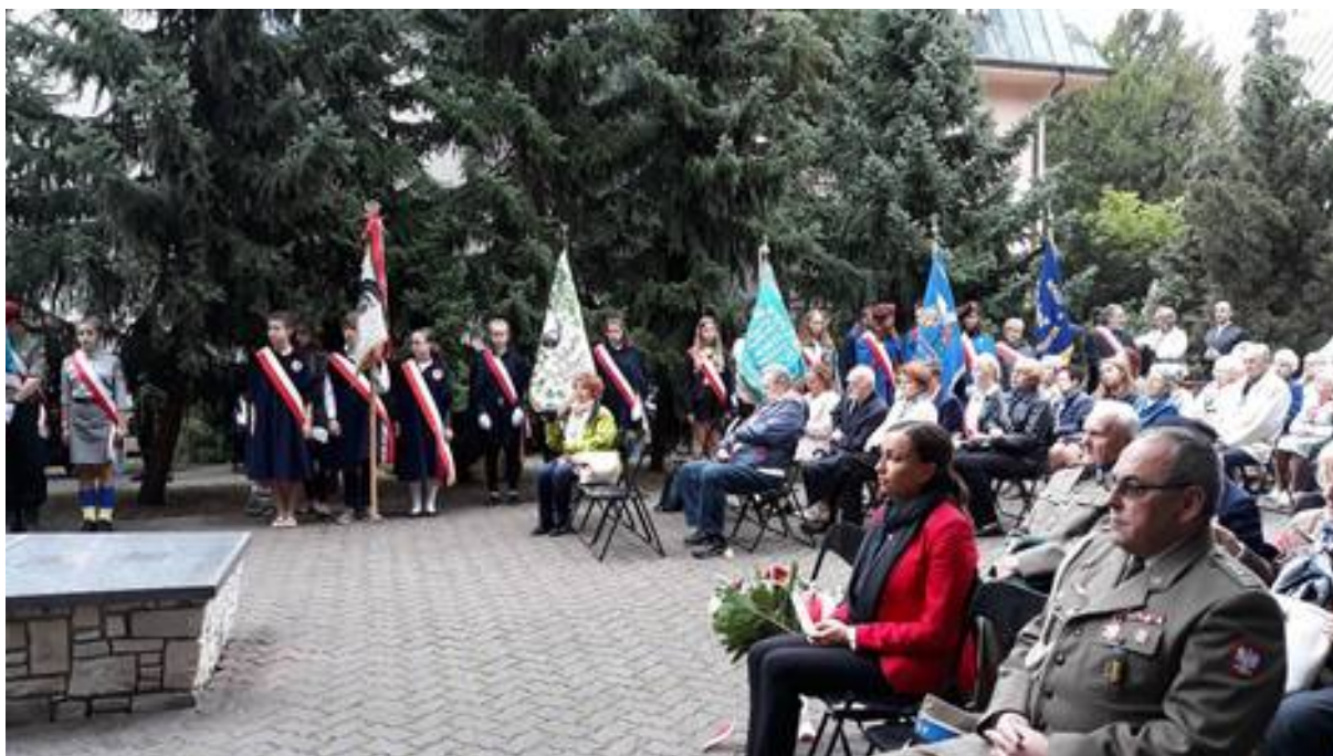
Przy ul. Wittiga 10

Ponadto dla uczczenia naszych masowych zsyłek (I-sza 10.02.1940r, II-ga 12/13.04.1940r., III-cia 28/29.06.1940 i IV-ta 21.06.1941r. – łącznie zesłano ponad 1.5 mln obywateli Polski, przy czym pamiętajmy że III i IV to były masowe wysiedlenia w okresie maj-czerwiec, a podane daty – to jako symbolika), a napaść ZSRR na Polskę w dniu 17.09.1939r. obchodzimy jako: Światowy Dzień Sybiraka /ustanowiony w 1991r./ W tych dniach staramy się uczestniczyć razem z żołnierzami Wojska Polskiego, harcerzami i uczniami /z Pocztami Sztandarowymi/ - przy ważnych miejscach, poświęconych Zesłańcom i Żołnierzom, którzy zginęli w latach 1939 -1956!