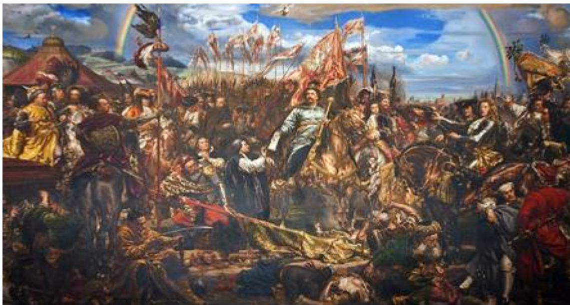
„Jan III Sobieski wysła wiadomość o zwycięstwie papieżowi Innocentemu XI” – Jan Matejko

Umiejętność dowodzenia i atak husarii spowodował ucieczkę wojsk tureckich i tatarskich, a wojska sprzymierzonych zajęły obóz wroga. W bitwie zginęło ok. 10 tys. Turków i Tatarów, a 5 tys. było rannych. Wojsko sprzymierzonych poniosło straty w ilości 1.5 tys. zabitych i 2.5 tys. rannych. Kara Mustafa poniósł śmierć przez uduszenie, za przegraną wojnę, a Imperium Osmańskie zakończyło tym samym okres swoich zwycięstw! Polacy, tak jak w zwycięskiej bitwie pod Grunwaldem, tak i teraz nie wykorzystali zwycięstwa, mimo, że sam cesarz złożył Janowi III Sobieskiemu hołd pod Wiedniem!