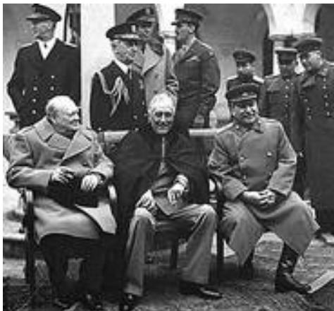
Dzięki Nim – byliśmy „sprzedani przyjaciółom” ze wschodu /J. W. Stalin, F. D. Roosevelt i W. Churchill/

W tymże dniu w krypcie św. Leonarda na Wawelu zostały złożone, sprowadzone z Wielkiej Brytanii prochy gen. broni Władysława Sikorskiego /20.05.1881 – 4.07.1943/ - premier i min. Spraw wojskowych II Rzeczypospolitej. Twórca i naczelny wódz Polskich Sił Zbrojnych na Zachodzie. Zginął w katastrofie lotniczej w Gibraltarze. Sprawa do dzisiaj nie wyjaśniona!