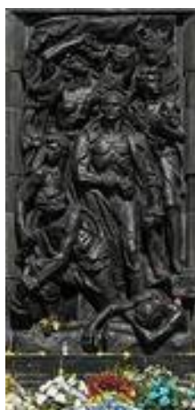
Pomnik Bohaterów Getta