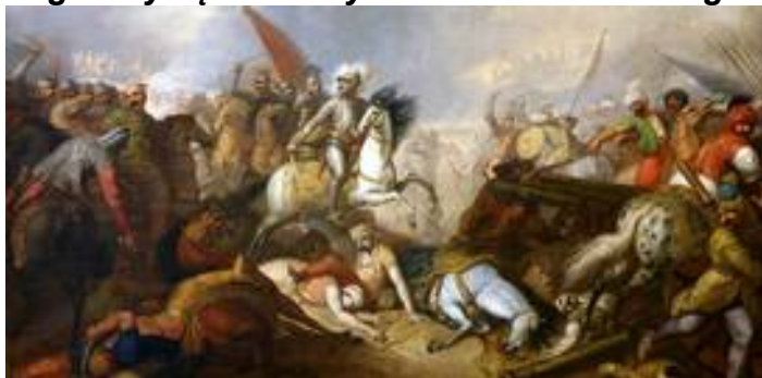
Obraz Franciszka Smuglewicza

Te walki po 1990 r. zostały upamiętnione na Grobie Nieznanego Żołnierza w Warszawie, napisami: CHOCIM 2 IX – 9 X 1621 i 10 – 11 XI 1673. Bądźmy dumni z tego zwycięstwa i wyboru Jana Sobieskiego na króla Polski.