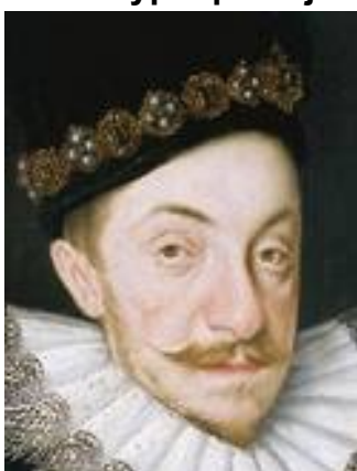
Zygmunt III Waza 1587 – 1632

CZERWIEC – poświęcam Wazom, królom Szwecji /1523 – 1654/ i Rzeczypospolitej Obojga Narodów /1587 – 1668/. Dynastię Wazów założył regent Szwecji Gustaw Waza /syn możnowładcy Eryka Johansona - straconego w 1520r. z polecenia króla duńskiego Chryściana II. Gustaw I objął tron w 1532. Królami Rzeczypospolitej z dynastii Wazów byli: