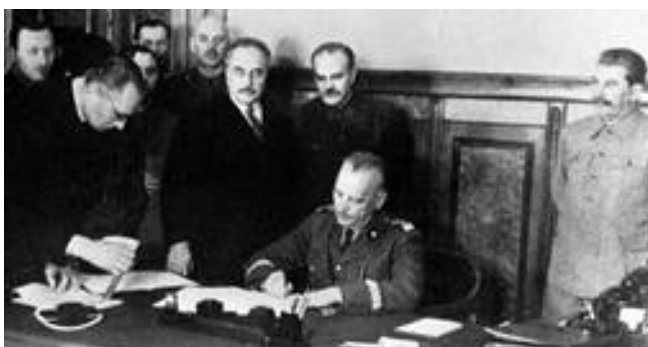
Układ ze Stalinem /3-4.12.1941/