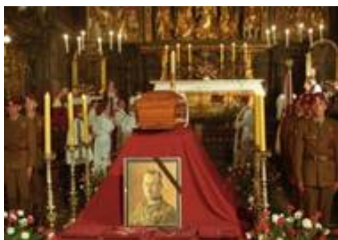
Pogrzeb na Wawelu /17.09.1993/

W tymże dniu w krypcie św. Leonarda na Wawelu zostały złożone, sprowadzone z Wielkiej Brytanii prochy gen. broni Władysława Sikorskiego /20.05.1881 – 4.07.1943/ - premier i min. Spraw wojskowych II Rzeczypospolitej. Twórca i naczelny wódz Polskich Sił Zbrojnych na Zachodzie. Zginął w katastrofie lotniczej w Gibraltarze. Sprawa do dzisiaj nie wyjaśniona!