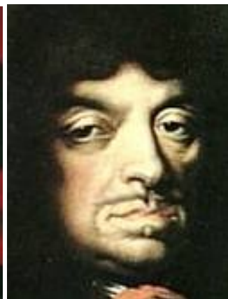
Jan II Kazimierz Waza 1648 – 1668

Władysław IV i Jan II Kazimierz, to Synowie Zygmunta III – wyznawcy katolicyzmu i za to był zwalczany przez Szwedów i w 1599 został pozbawiony korony. Niemniej synowie, dalej używali tytułów królów Szwecji – a to m. in. doprowadziło do wojen polsko-szwedzkich w XVII w. Wojny ze Szwecją trwały z przerwami, blisko 60 lat /1600 -1660/. W tym czasie Polska nawiązała kontakty z Austrią, co pogorszyło stosunki z Turcją obok wypadów kozaków nad morze Czarne i interwencji polskich na ziemi lenne Turcji w Mołdawii.