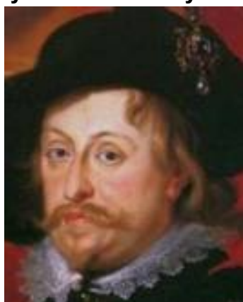
Władysław IV Waza 1632 – 1648