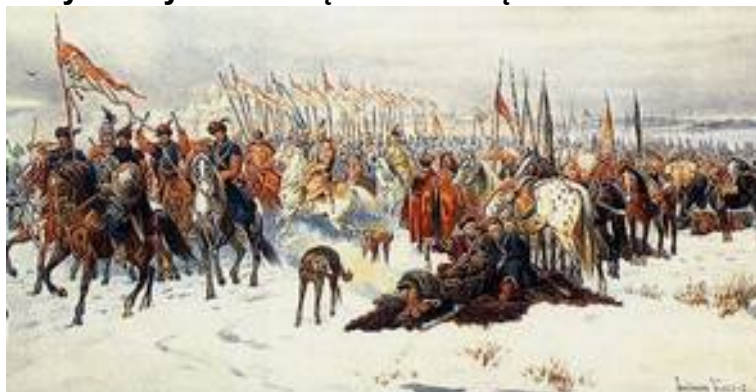
Autor, jak w podpisie

25.02.1634 – Polacy zdobyli twierdzę smoleńską.