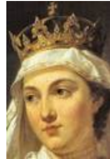
Jadwiga Andegaweńska 1386 – 1399

04.02.1454 – Związek Pruski wypowiedział posłuszeństwo Zakonowi i opanował wszystkie zamki za wyjątkiem Malborka i Sztumu. 21.02- Związek przekazał władzę nad opanowanym terytorium królowi polskiemu. 10.02 – ślub Kazimierz Jagiellończyk poślubił Elżbietę Rakuszanę, córkę Albrechta Habsburga, która zrzekła się z sukcesji w księstwie austriackim.