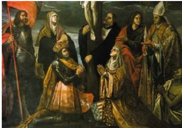
13 – letnia Jadwiga wychodzi za mąż za ponad 23 letniego Jagiełłę /obraz T. Dolabelli/

02.02.1386 – zjazd walny w Lublinie, jednogłośnie wybrał Jagiełłę na króla Polski. 15.02- w Krakowie Władysław Jagiełło przyjął chrzest. 18.02- Ślub Jadwigi z Władysławem, która wcześniej odwołała śluby z Wilhelmem Habsburgiem.