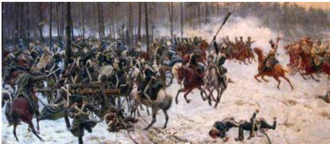
Jan Rosen. Bitwa pod Stoczkiem

25.02.1832 – car w Warszawie powołał Najwyższy Sąd Kryminalny – do osądzenia przywódców powstania listopadowego. Sąd skazał na karę śmierci lub katorgę ok. 200 powstańców. W tym Piotra Wysockiego i Wincentego Niemojowskiego, którym karę śmierci zamieniono na dożywotną katorgę. Przywódcom skazanym na karę śmierci /Maurycygo Mochnackiego, ks. Adama Jerzego Czartoryskiego, Joachima Lelewela, Jana Skrzyneckiego i innych/, skonfiskowano również majątki. Łącznie ok. 3000 majątków. 26.02- Mikołaj I zniósł konstytucję, wcielił Królestwo do Cesarstwa Rosyjskiego oraz zlikwidował polski sejm, armię oraz odrębny budżet. Władza spoczywała w rękach namiestnika feldmarszałka Iwana Paskiewicza, który otrzymał tytuł księcia warszawskiego.