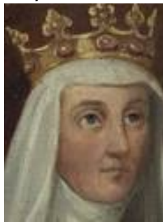
Elżbieta Granowska 1417 – 1420