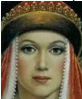
Zofia Holszańska 1422 – 1434

07.02.1422 – Jagiełło poślubił 17- letnią ruską kniaziównę holsztyńską Zofię, mimo sprzeciwu rady królewskiej. Czwarą żoną urodziła królowi 3 synów (Władysława III Warnenczyka /1424/, Kazimierza /1426 umarł po roku/ i Kazimierza-Andrzeja /1427/).