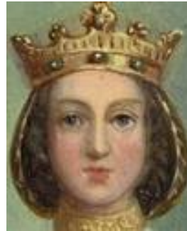
Anna Cylejska 1402 – 1416