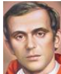
bł. J. Popiełuszko

06.02 – 05.04.1989 – rozpoczęły się obrady Okrągłego Stołu, czyli rozmowy „rządowo-koalicyjne” ze stroną „solidarnościowo-opozycyjną” – pod przewodnictwem Czesława Kiszczaka i Lecha Wałęsy. Ponoć rozpoczął się nowy demokratyczny rozdział w życiu Polaków? 15.02- sejm ustanowił 11.11 dniem święta narodowego. Rocznica odzyskania niepodległości w 1918 r. Chwała Polakom!