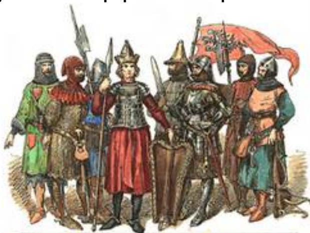
Rycerstwo polskie 1333-1434 /wg Jana Matejki/

9 grudnia 1410 – w Nieszawie zawarto rozejm polsko-krzyżacki. Grudzień 1414 – Wojna głodowa pomiędzy Polską a Zakonem – była prowadzona w celu odzyskania strat Polski na rzecz Zakonu z Pomorzem Gdańskim na czele. Nie udało się, gdyż Jagiełło nie miał poparcia miast pruskich