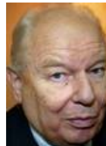
Marek Edelman Adam Strzembosz Andrzej Wajda Andrzej Stelmachowski

10.12.1989 – rozebrano pomnik Lenina w Nowej Hucie, jako protest przeciwko komunistom i ich przywódcy... 29.12- nowelizacja konstytucji; usunięto zapisy o roli PZPR i sojuszu z ZSRR oraz zmieniono nazwę państwa na Rzeczpospolitą Polskę. Zrezygnowano z nazwy „Polska Rzeczypospolita Ludowa”. 31.12- zmieniono konstytucję Polskiej Rzeczypospolitej Ludowej podczas której m.in. zmieniła nazwę państwa na Rzeczpospolita Polska i przywrócono koronę orłowi białemu w Godle Polski. Początek realizacji planu Balcerowicza ... wielu ludzi zbankrutowało /i jeszcze gorzej!!!