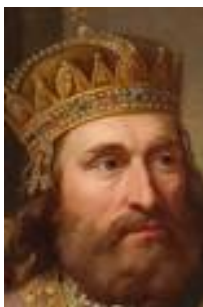
Ludwik Węgierski Wielki

12.1363 – sąd arbitrów w Krakowie w osobach Kazimierza Wielkiego i ks. świdnickiego Bolka zalecił: pojednanie się cesarza Karola IV z królem Węgier – Ludwikiem.