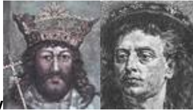
Władysław Jan Olbracht

12 grudnia 1501 – Aleksander Jagiellończyk został koronowany na króla Polski. Tron odziedziczył po zmarłym bracie Janie Olbrachcie, tym samym przywrócił zerwaną z 1492 roku unii personalnej między Koroną a Litwą. „Ceremonia koronacji odbyła się tradycyjnie w katedrze wawelskiej. Poprowadził ją rodzony brat Aleksandra, Fryderyk Jagiellończyk. Na uroczystości obecna była również matka nowego monarchy”.