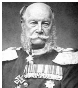
Wilhelm I Hohenzollern – cesarz niemiecki