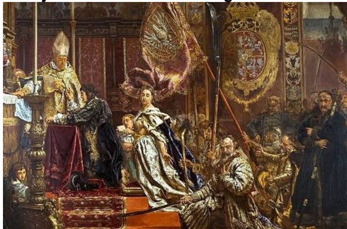
Śluby Jana Kazimierza

17.10.1655 – król Jan Kazimierz opuścił Polskę i udał się na austriacki Śląsk. Wrzesień–październik 1655 – oblężenie Krakowa. 19.10.1655 – wyniku braku odsieczy Stefan Czarnecki skapitulował z obrony Krakowa /3.10 – Szwedzi pokonali armię Korony pod Wojniczem, a 30.09 pod Nowym Dworem – pospolite ruszenie województwa mazowieckiego/.