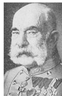
Franciszek Józef I – cesarz Austrii i król Węgier

27.10.1873 – władze pruskie w szkołach elementarnych wprowadzili język niemiecki. W języku polskim można było nauczać religie i pieśni kościelne.