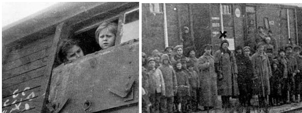
Znam to z autopsji ...

Październik 1939 – z Kresów Wschodnich w głąb ZSRR wywieziono ok. 55000 Polaków!