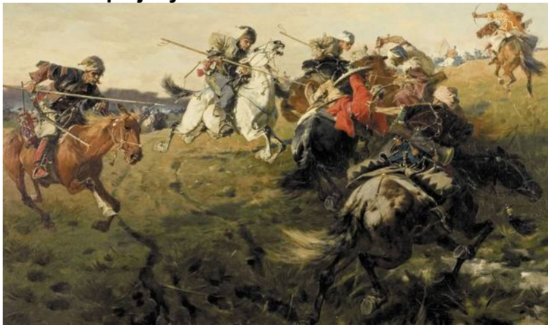
Potyczka Kozaków. Józef Brandt

9.10.1626 roku doszło do bitwy z Tatarami pod Białą Cerkwią. Wojna ze Szwecją zmusiła aby Stanisław Koniecpolski z Ukrainy ruszył nad Wisłę. Obrona Kresów z małą ilości wojska spoczywała w rękach regimentarza Stefana Chmielnickiego /5000 żołnierzy w tym 1500 Kozaków rejestrowych/. Tatarzy krymscy i Nogajowie wykorzystując osłabienie Polski na Ukrainie ruszyli we wrześniu pod Białą Cerkiew nad rz. Roś. Polacy pokonali najeźdźców, odebrali łup i jasyr.