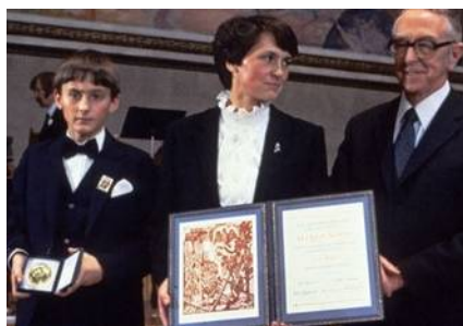
Nobel dla Wałęsy

5.10.1983 – Lech Wałęsa otrzymał pokojową Nagrodę Nobla. Odebrała żona Danuta.