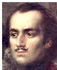
Kazimierz Pułaski /4(6).03.1745 – 11.10.1779/

10-22.10.1788 – Sejm Wielki podniósł etat armii do 100000 żołnierzy oraz powołano Komisję Wojskową Obojga Narodów.