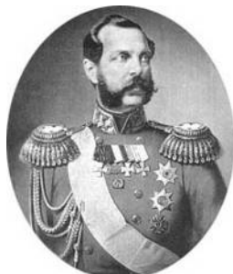
Aleksander II Romanow – cesarz Wszechrusi

22.10.1873 roku Rosja, Niemcy i Austro-Węgry zawarły Sojusz Trzech Cesarzy. Dążyli do zachowania pokoju w Europie oraz wzajemnej pomocy w razie agresji państw trzecich. Chcieli wskrzesić Święte Przymierze z 1815 r. Te państwa zajmowali 2/3 powierzchni Europy!