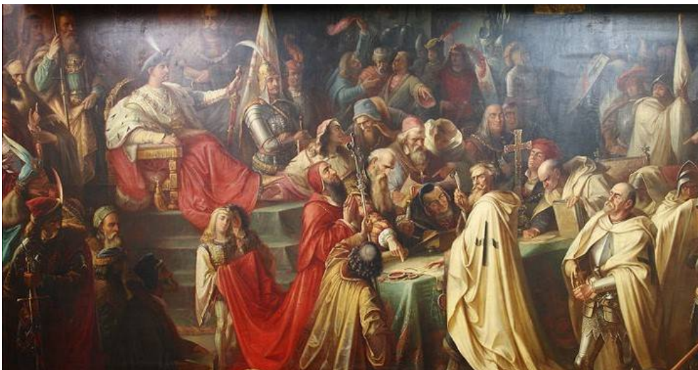
Obraz M. Jaroczyńskiego II Traktat toruński

19.10.1466 – zawarcie pokoju z Krzyżakami w Toruniu, kończący 13 letnią wojnę. Polska odzyskała Pomorze Gdańskie, ziemię chełmińską i michałowską a także część Prus z Malborkiem, Elblągiem i Sztumem oraz biskupstwo warmińskie /księstwo biskupie/. Pozostałe ziemie krzyżackie zostało jako lenne polskie.