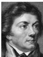
Tadeusz Kościuszko /4.02.1746 – 15.10.1817/

11.10.1779 roku w bitwie pod Savannah zginął w wyniku odniesionych ran bohater Polski i Stanów Zjednoczonych - Kazimierz Pułaski. Organizator kawalerii amerykańskiej. 13.10.1780 – Tadeusz Kościuszko otrzymał stopień generała armii amerykańskiej, za ufortyfikowanie Filadelfii oraz systemy fortyfikacyjne w Charleston i West Point /T. Kościuszko zmarł w Szwajcarii w Solurze - 15.10.1817/.