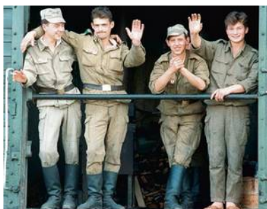
Ostatni żołnierz ACz opuszcza Polską 17.09.1993 r.

26.10.1994 – prof. Karolina Lanckorońska /11.08.1989 – 25.08.2002/ mieszkająca w Rzymie przekazała narodowi polskiemu ok. 300 dzieł sztuki ze zbiorów rodzinnych w tym 120 obrazów meble, itp. Polska historyk i historyk sztuki. Nauczycielka akademicka Uniwersytetu Jana Kazimierza. Żołnierz AK. Więzień Ravensbrück. Oficer prasowa 2 Korpusu Polskiego PSZ. Pisarka, członkini Polskiej Akademii Umiejętności.