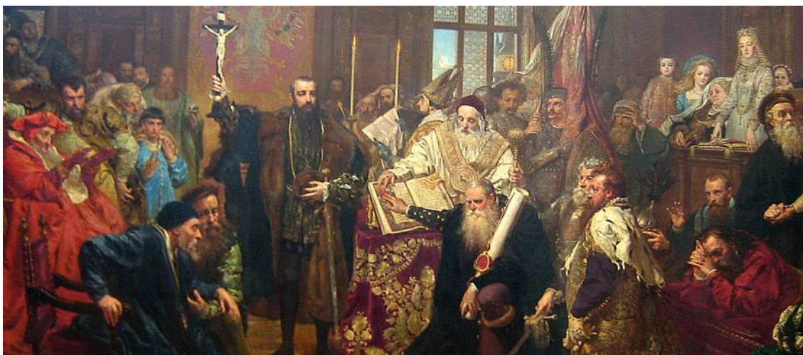
Unia Lubelska /Jana Matejko/

Dzwon do dnia dzisiejszego głosi Polsce i Polakom ważne wydarzenia z życia naszego kraju i Polaków!