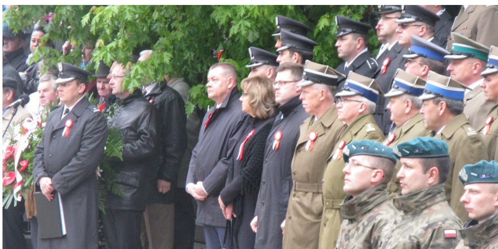
Przedstawiciele władz wojewódzkich, miejskich, wojska: służba zawodowa i emeryci