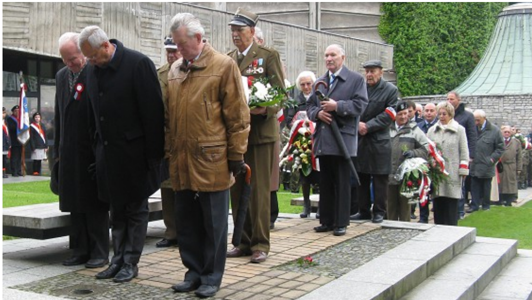
Wieniec od Generałów Wojska Polskiego

Kolejne delegacje z naszego województwa i miasta składają wieńce: