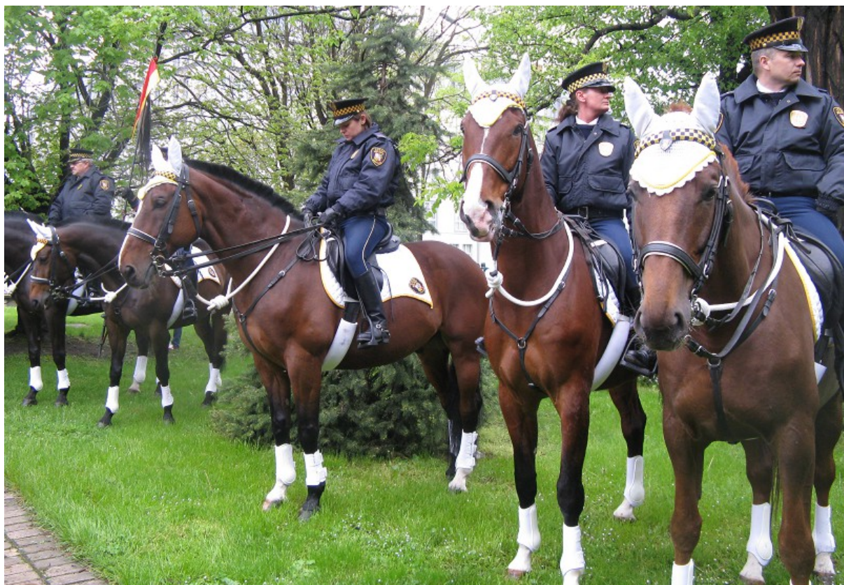
Straż miejska pilnuje porządku, a nie rozgania – uczestników święta Konstytucji 3 Maja