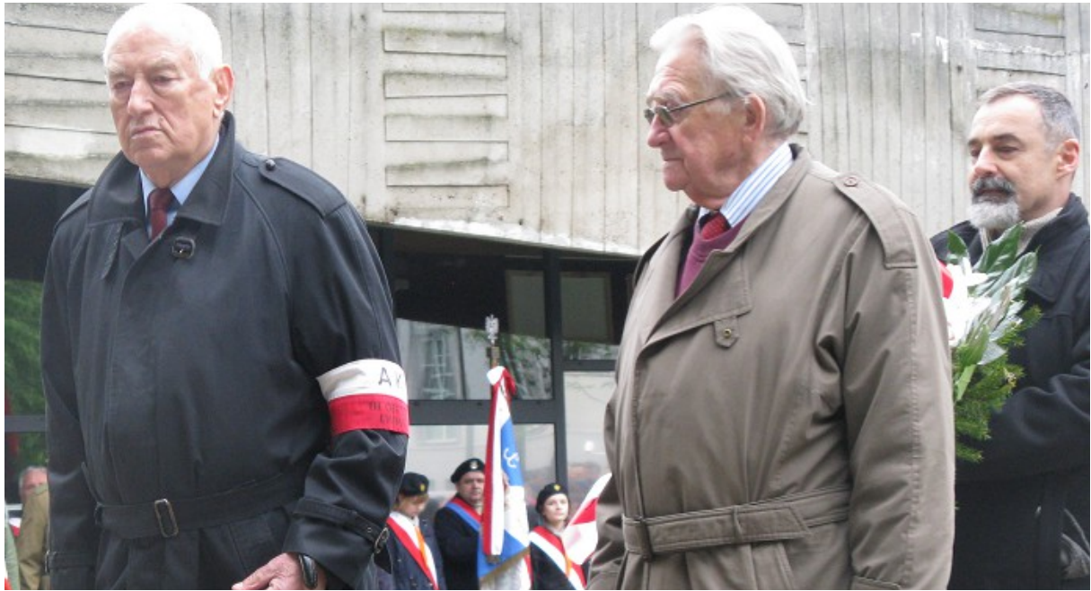
Kwiaty od przedstawicieli AK III Okręg Lwów