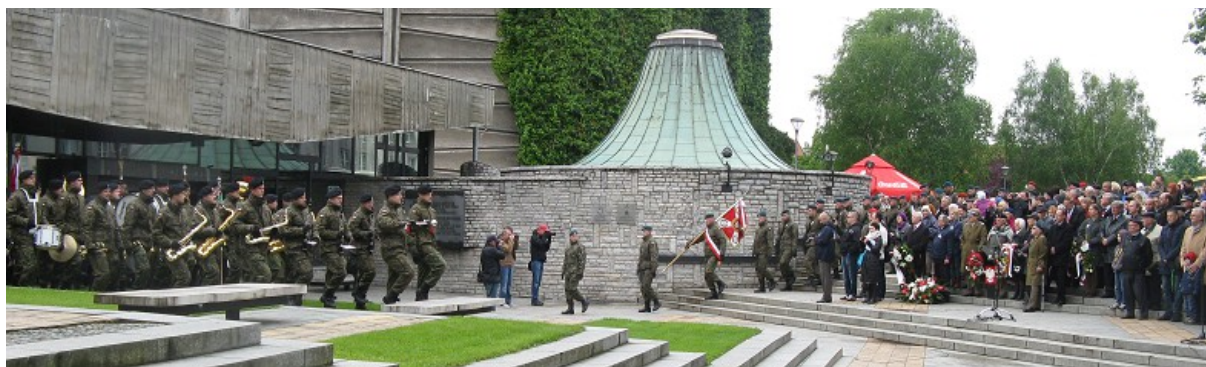
Przed 12.00 na plac przed Panoramą Racławicką wchodzi orkiestra i poczet sztandarowy z kompanią honorową