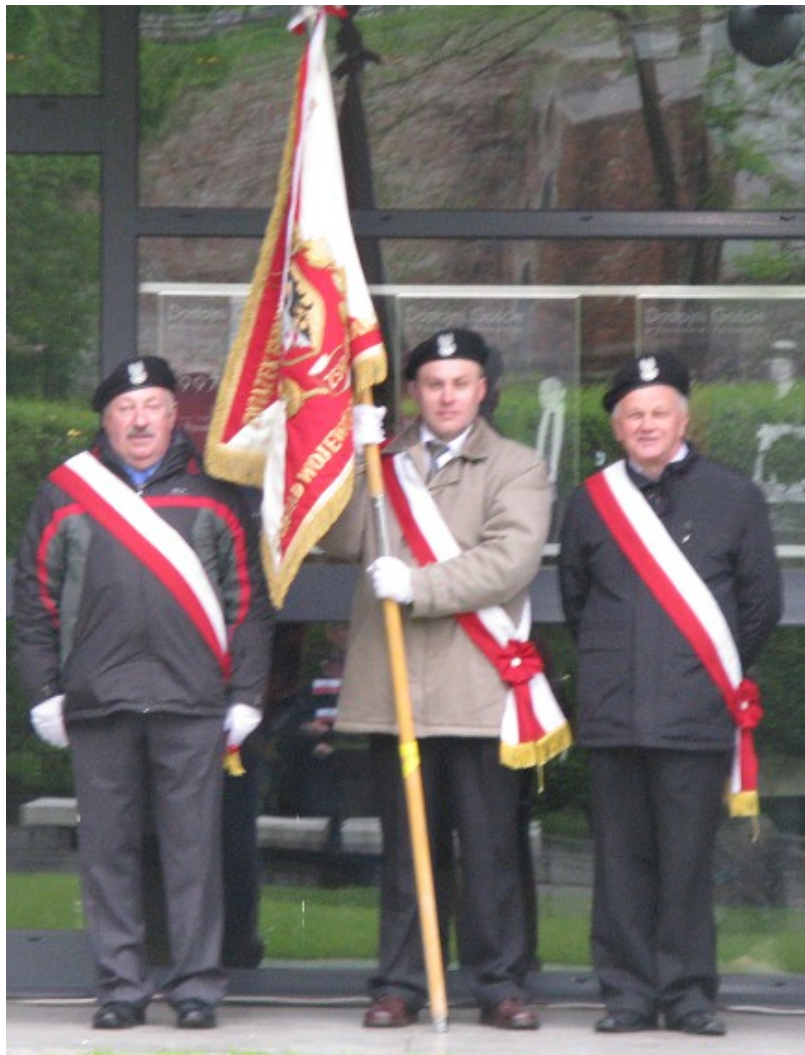
Nasz poczet sztandarowy