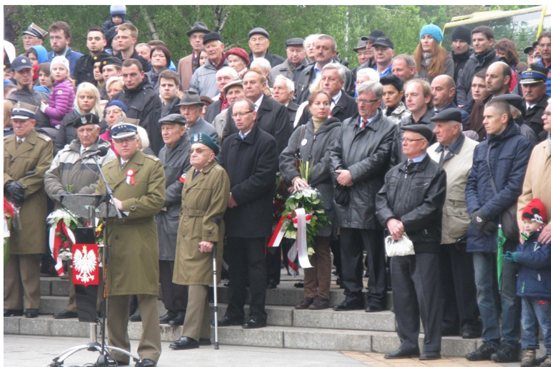
Przemawia przedstawiciel Wojska Polskiego