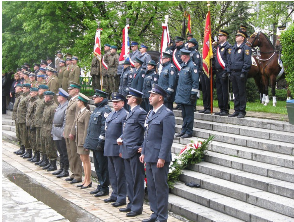
Przedstawiciele wojska i służb mundurowych