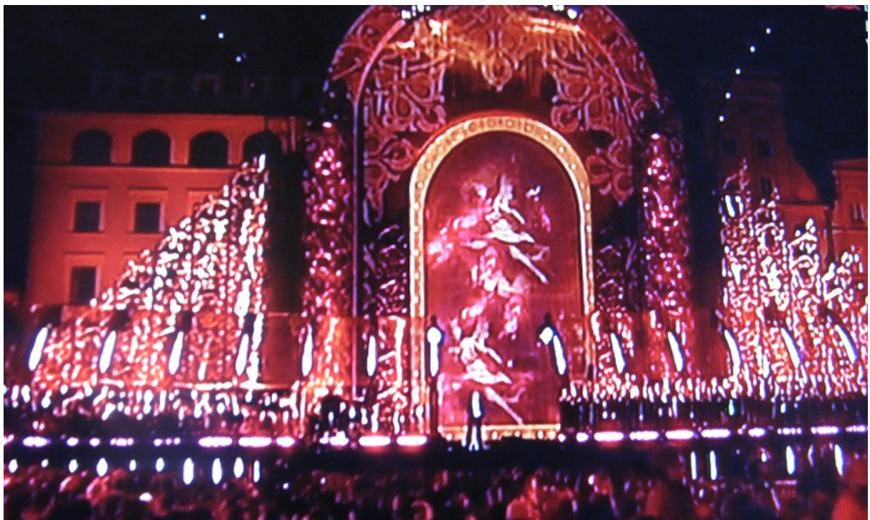
Ogólny widok sceny koncertowej w Rynku