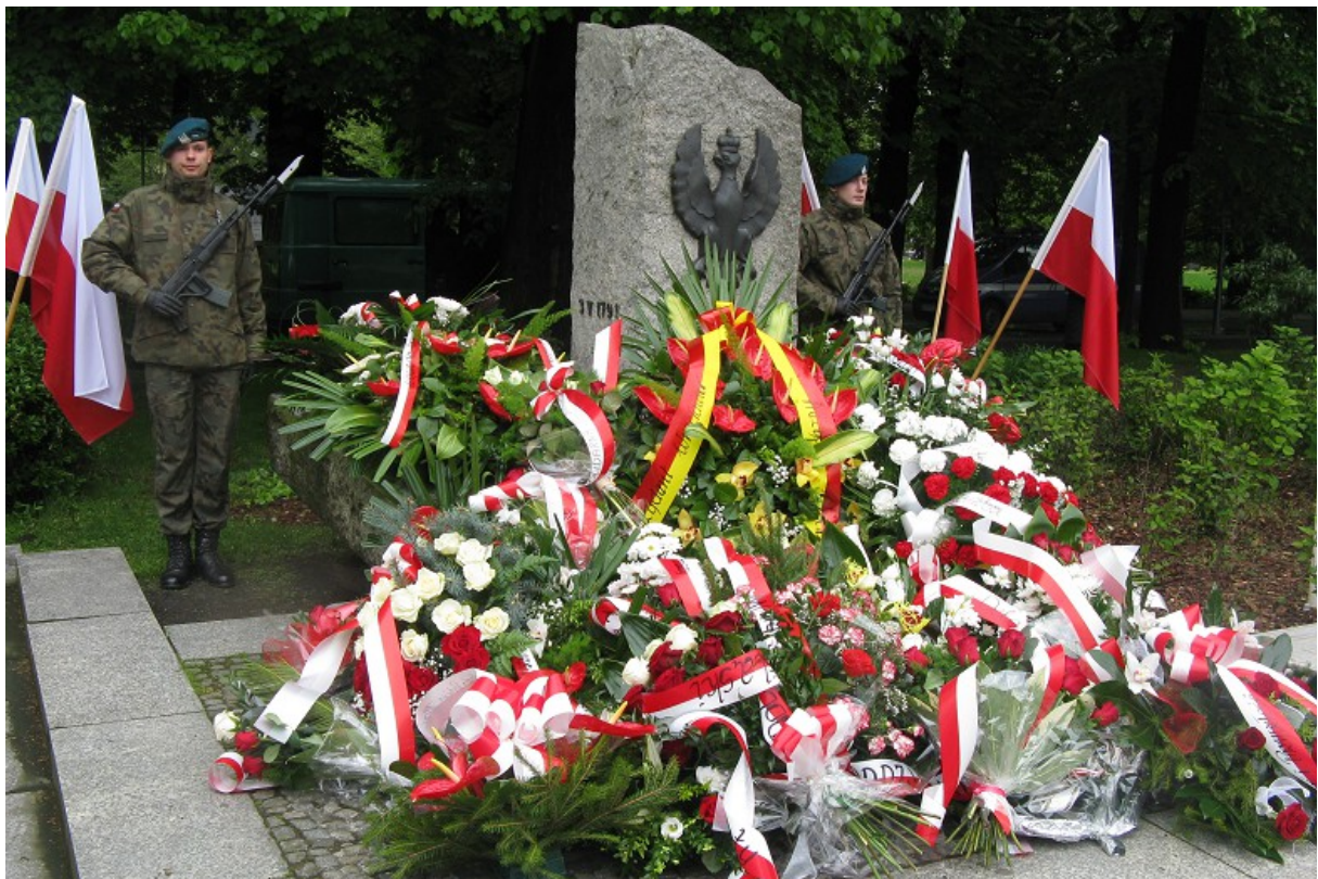
... i po złożeniu wieńców i kwiatów