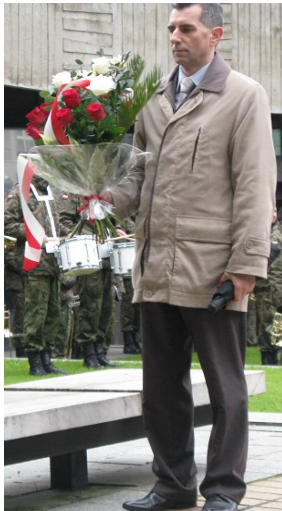
Po złożeniu wieńców i kwiatów uformował się pochód. Który przemaszerował ulicami Wrocławia do Katedry.