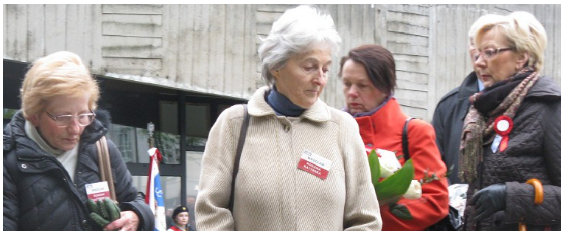
Kwiaty składa Rodzina Katyńska