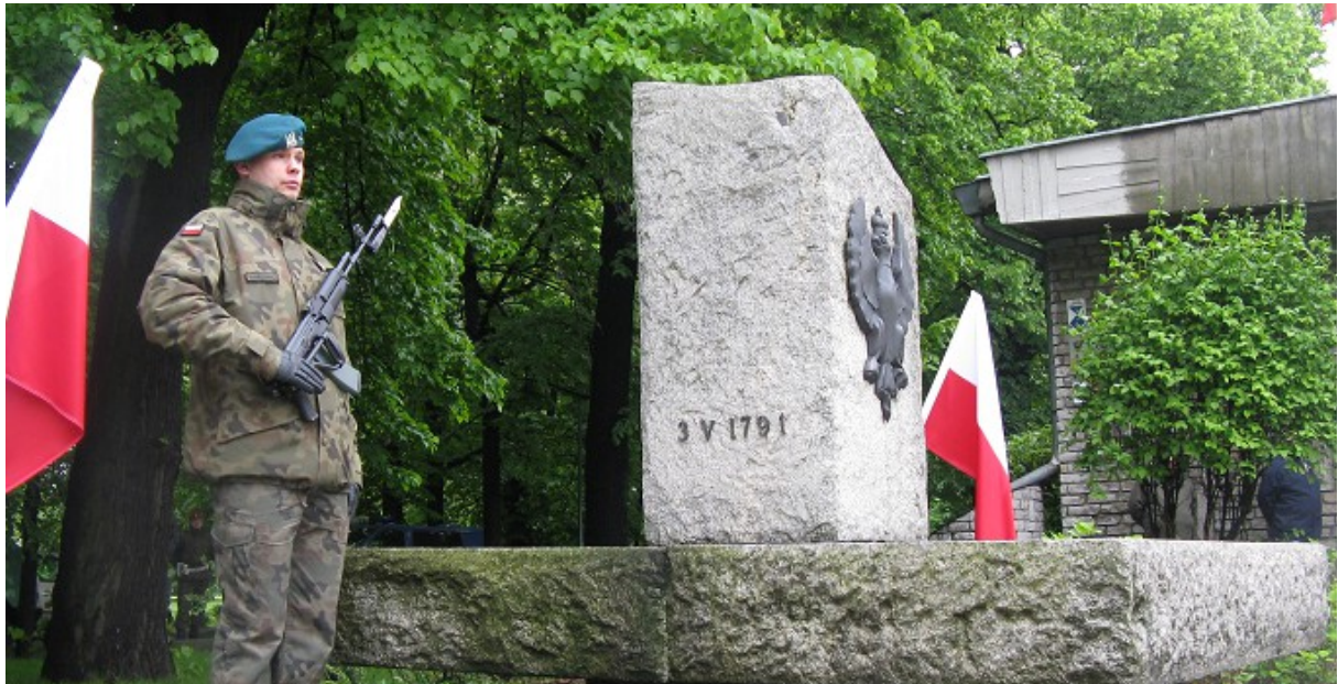
Widok na Pomnik przed uroczystością...