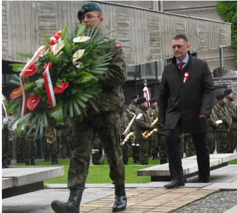
Pierwszy wieniec od Wojewody Dolnego Śląska