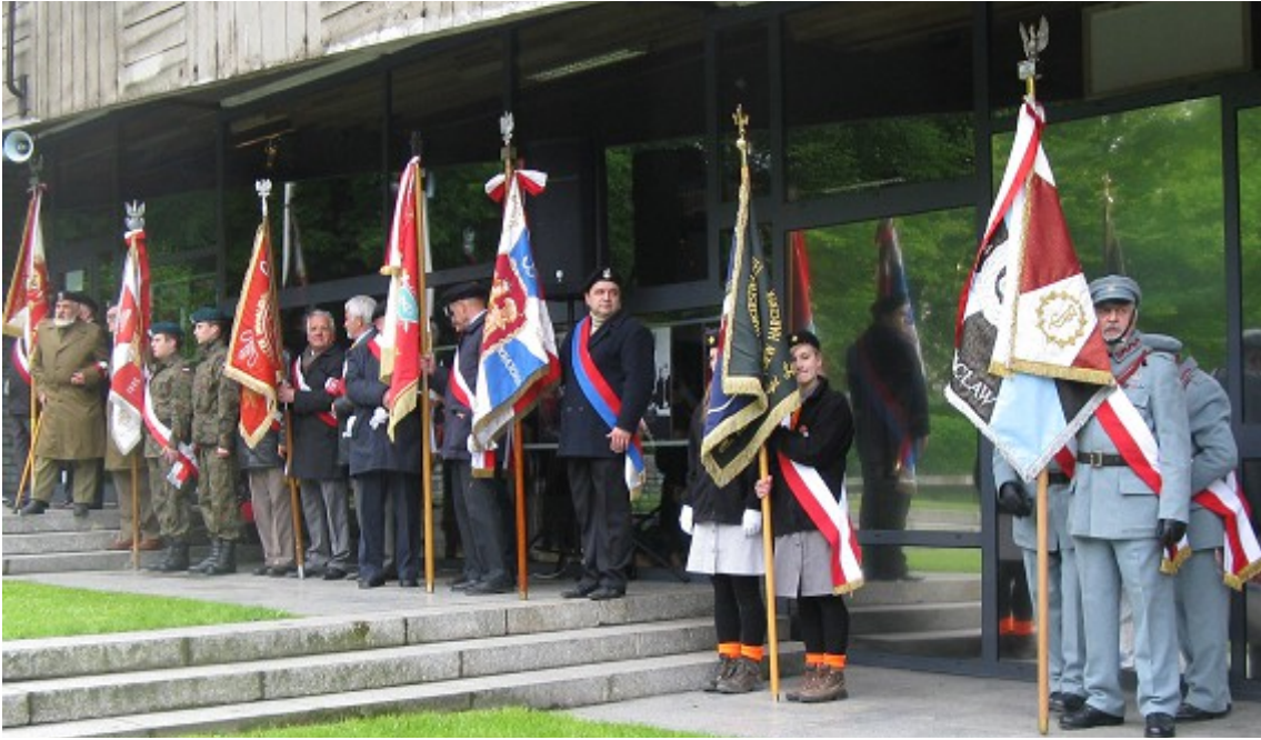
Koło Panoramy Racławicką ustawiają się poczty honorowe