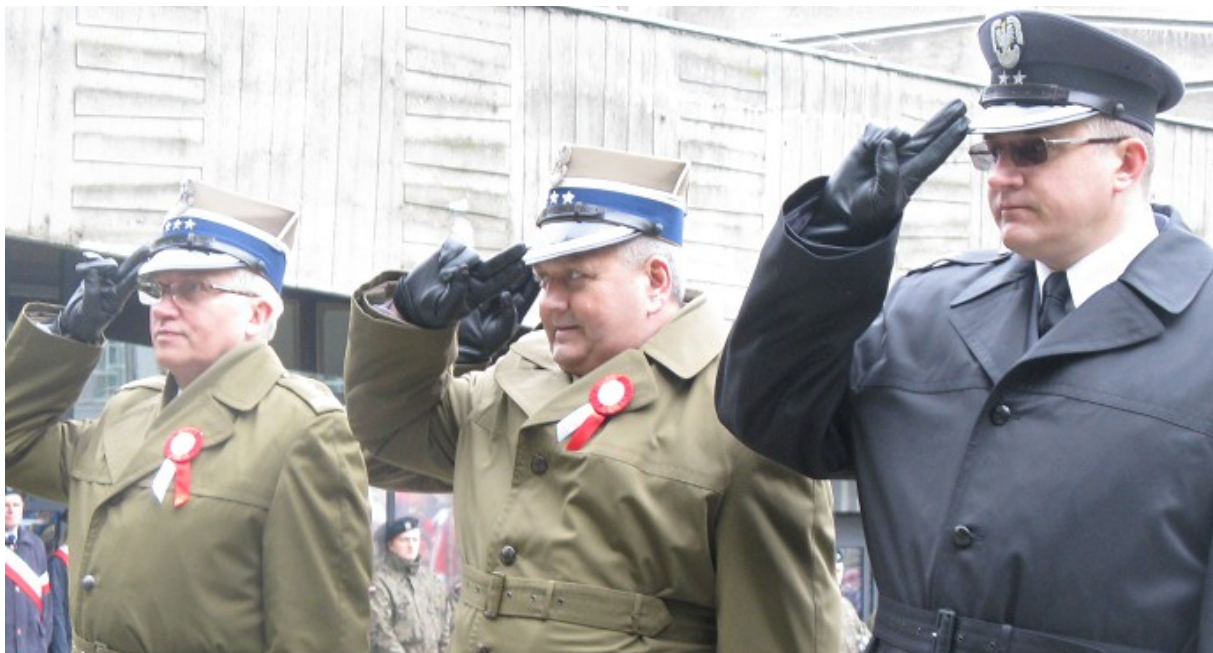
Przedstawiciele Wojska Polskiego