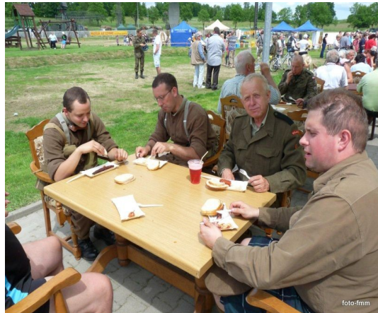
15.06.2013 r. Wielkie zainteresowanie publiczności prezentowanymi eksponatami sprzętu wojskowego. Piknik trwał wiele godzin.