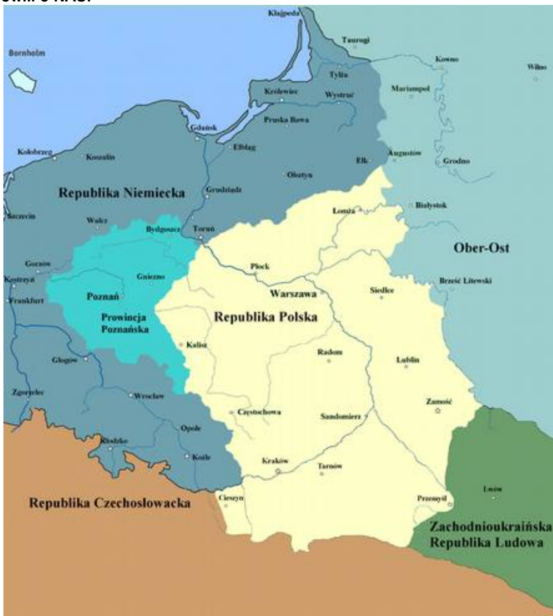
Granice Polski w połowie listopada 1918 r.

Dlatego starajmy się zdrowym rozsądkiem, sercem i patriotyzmem, jak to czynili Polacy mimo „różnych wiatrów dziejowych” zachować ją, tzn. NIEPODLEGŁOŚĆ POLSKI – dla potomnych, żeby za kolejne 100 lat podobnie mówili o NAS!