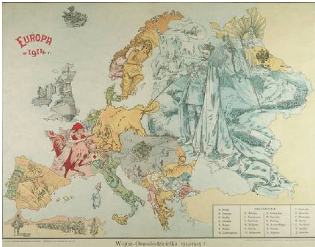
Ciekawy sposób przedstawienie Europy w l. 1914-1915