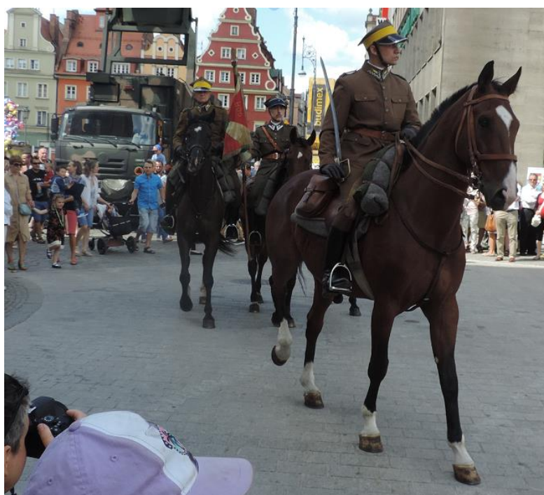
„Ułani” zamykają maszerujące pododdziały