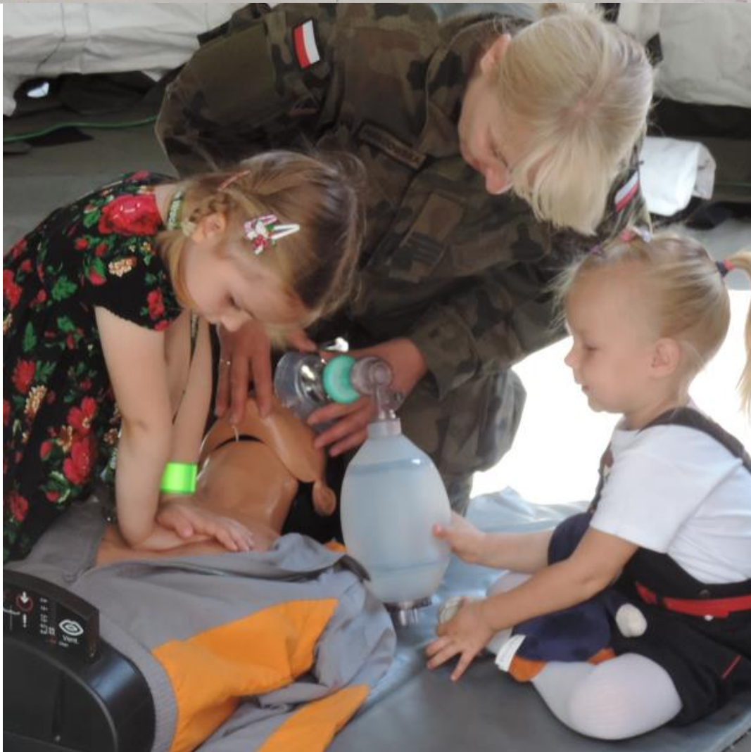
Nauka ... udzielania PIERWSZEJ POMOCY