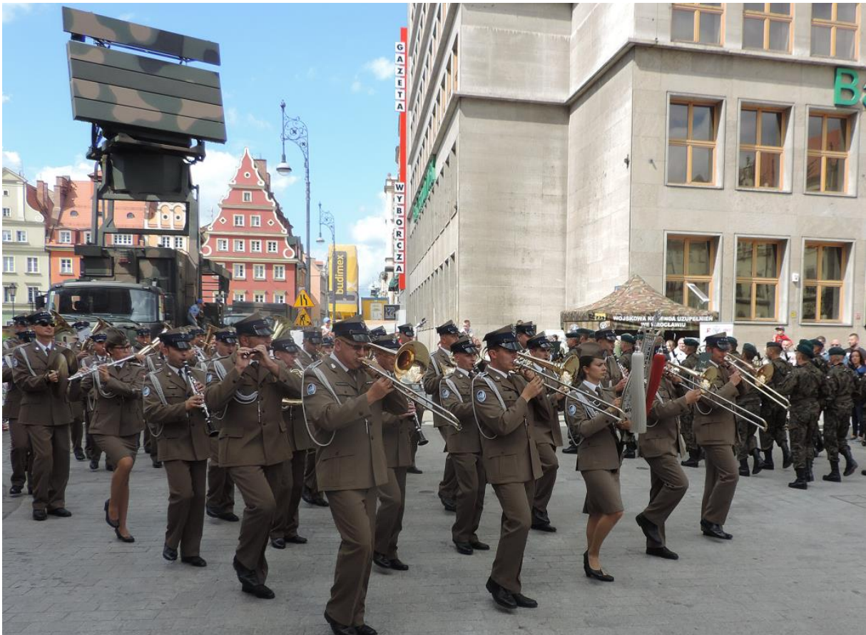
DO DEFILADY ... w tym rok pododdziały maszerowały z Placu Solnego na Plac Gołębi