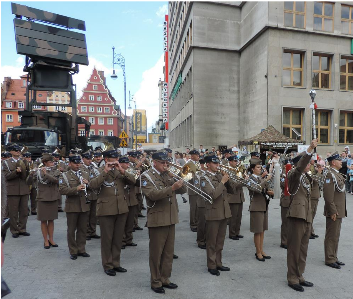
... MARSZ ...