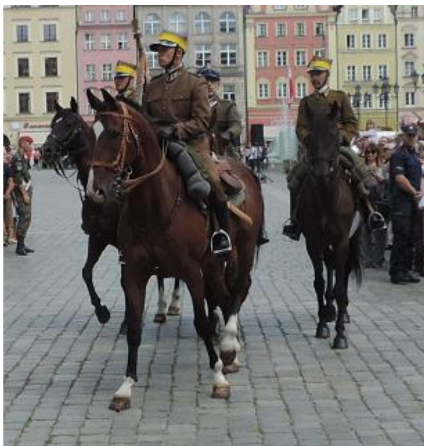
Ułani ... Ułani ...