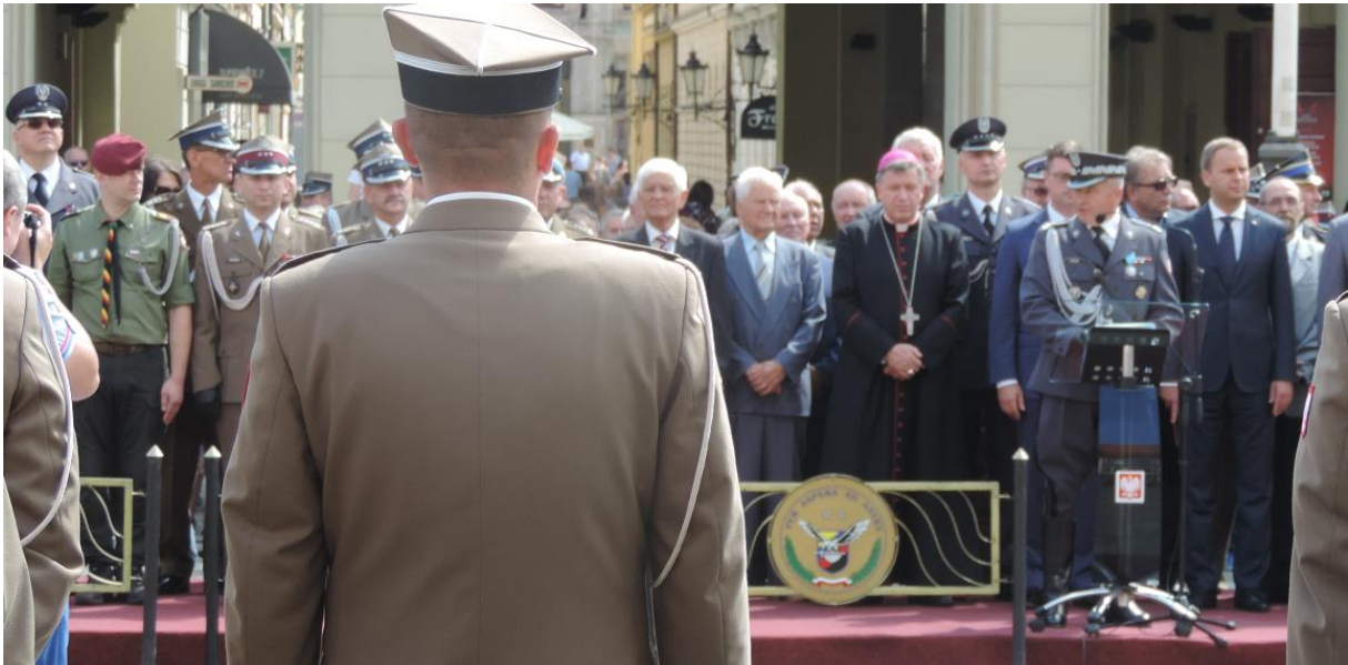
Nasi dostojnicy wojskowi i cywilni biorący udział w uroczystości