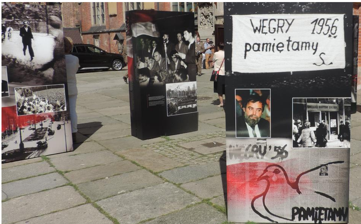
Gołąbek Pokoju ... oby był tylko Gołąbkim Pokoju /bez leninowskiej nagrody/