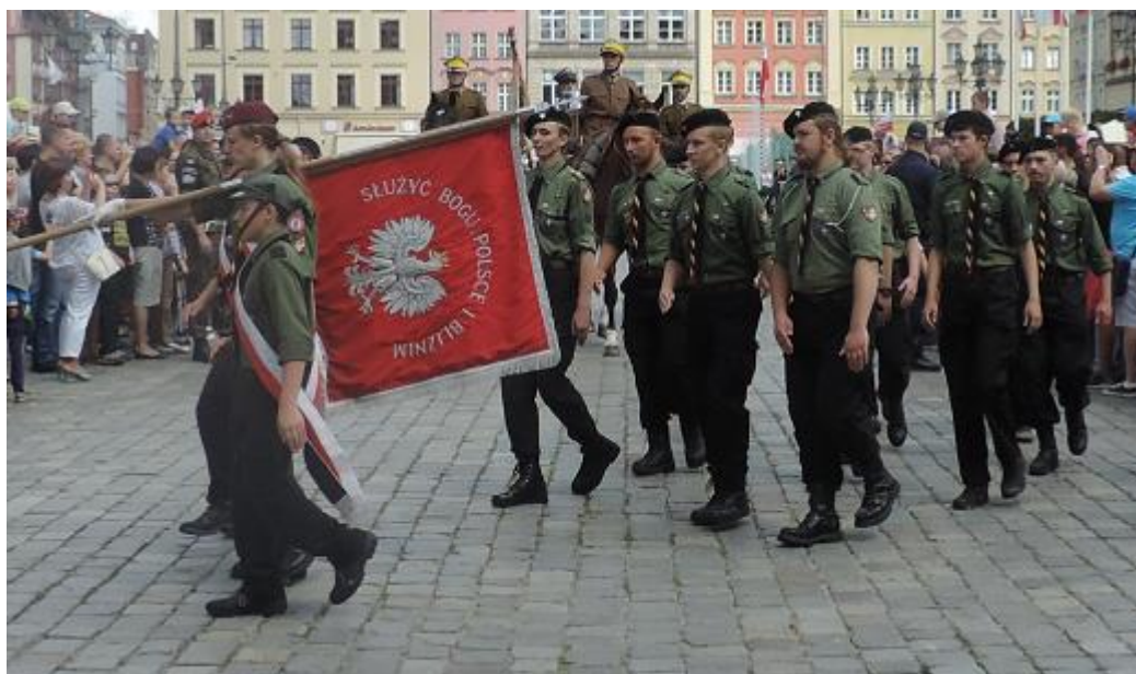
Piękne hasło harcerzy: „SŁUŻYĆ BOGU, POLSCE I BLIŹNIEMU”