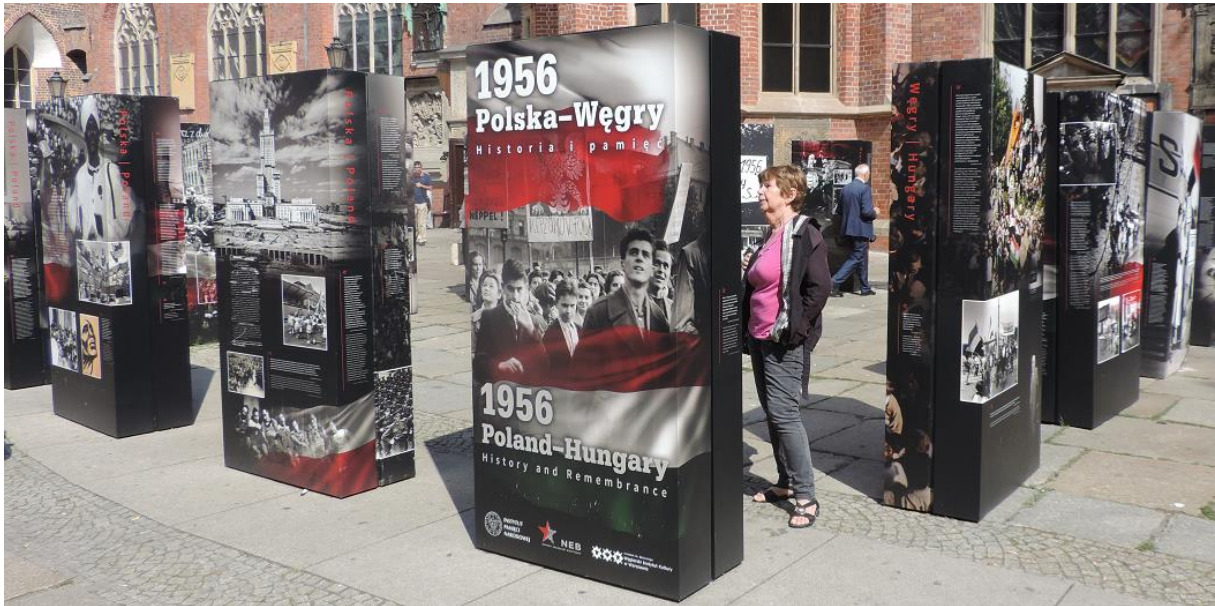
Wystawa przy Bazylice Mniejszej