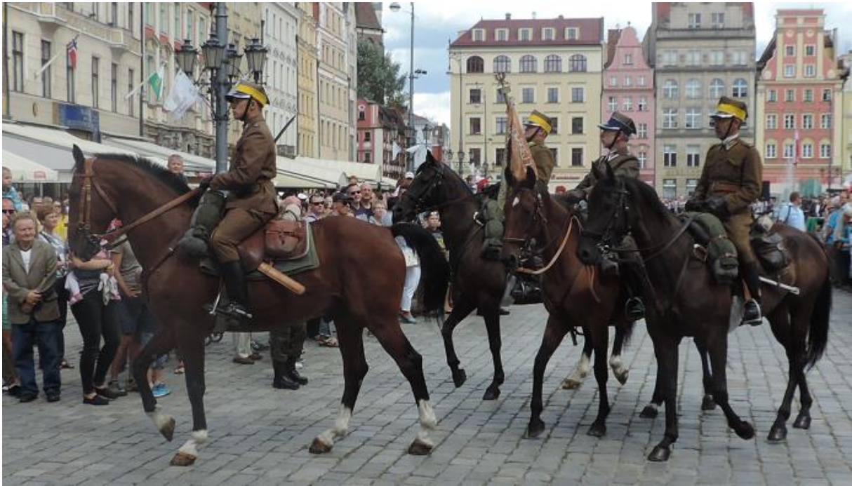
Konie ... ach te konie ...