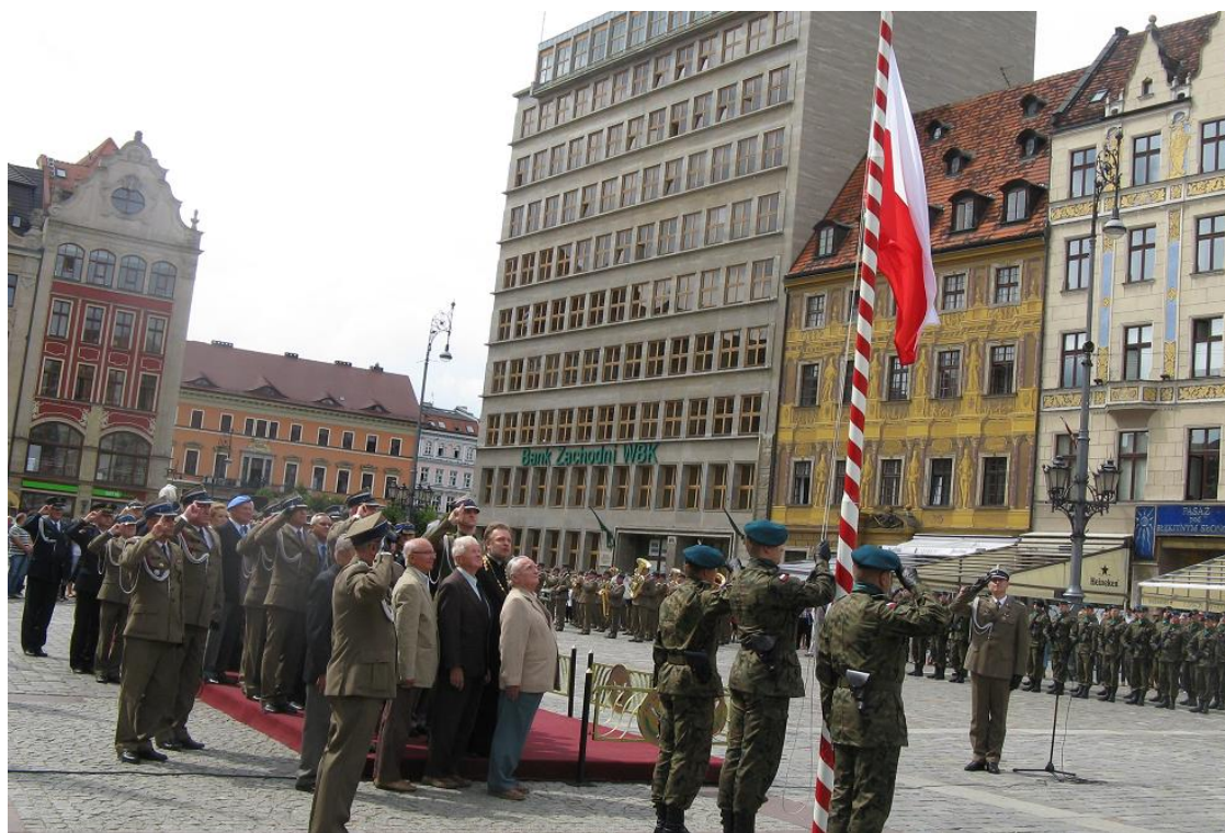
Flaga na maszt...oby tak było po wsze czasy!!! ...a BIAŁA-CZERWONA łopotąła pod polskim niebem

„Za pracę i wytrwałość, za ofiarę i krew, za odwagę i śmiałość dziękuję wam, żołnierze, w imieniu całego narodu i Ojczyzny naszej. [...] Żołnierz, który tyle zrobił dla Polski, nie zostanie bez nagrody. Wdzięczna Ojczyzna nie zapomni o nim. [...] Zaproponowałem już rządowi, by część zdobytej ziemi została własnością tych, co ją polską zrobili, uznawszy ją polską krwią i trudem niezmiernym. Żołnierze! Zrobiliście Polskę mocną, pewną siebie i swobodną. Możecie być dumni i zadowoleni ze spełnienia swego obowiązku. Kraj, co w dwa lata potrafi wytworzyć takiego żołnierza, jakim wy jesteście, może spokojnie patrzeć w przyszłość”.