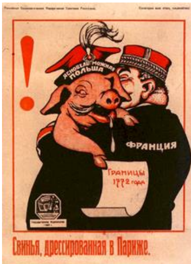
Świnia ćwiczona w Paryżu, antypolski plakat propagandowy Rosyjskiej Federacyjnej Socjalistycznej Republiki Radzieckiej z 1920 roku

„ Warto podkreślić, że ten moment w wojnie polsko-bolszewickiej jest uznawany za jeden z najbardziej kontrowersyjnych. Józef Mackiewicz uważa go za „najkrytyczniejszą chwilę w historii Polski”... Piłsudski uznał, iż Polska nie ma interesu państwowego w sukcesie Białych Rosjan i w konsekwencji uchylił się od wsparcia Denikina (pomimo nacisków Francji i Wielkiej Brytanii w tej sprawie)”.