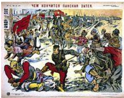
Sowiecki plakat propagandowy z 1920

„Plany S. Petlury i J. Piłsudskiego zakończyły się porażką. Zawiodły bowiem dwa czynniki: armia polska nie spełniła zadań operacyjno-okupacyjnych, a Dyrektoriat UNR nie zbudował trwałych fundamentów republiki”.