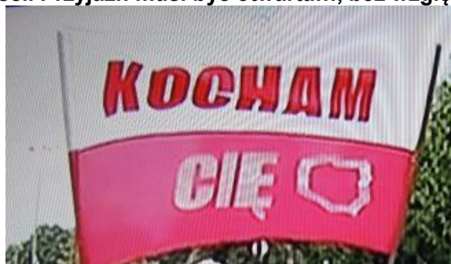
Piękne hasło jednego z Polaków idącego w tłumie Warszawiaków. O tym musimy pamiętać, bez względu na fakt, czy to był tylko pokaz sprzętu USA, NIEMIEC, czy nawet jeszcze ZSRR; czy też pokaz siły /Polski i NATO/

W trakcie dyskusji w dniu 14 i 15.08 z Kolegami nasunęły się niektóre spostrzeżenia wybrane z „Przeszłości” i ważne nawet dzisiaj, aby zrozumieć naszą historię i nasze święto, naszych polityków i dowódców, aby „Przyszłość” była pewniejsza i bezpieczniejsza!