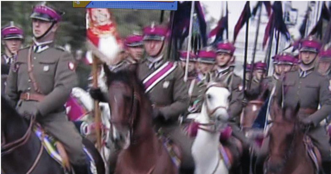
UŁANI – Oni m.in. odrzucili Bolszewików spod Warszawy w 1920 r.