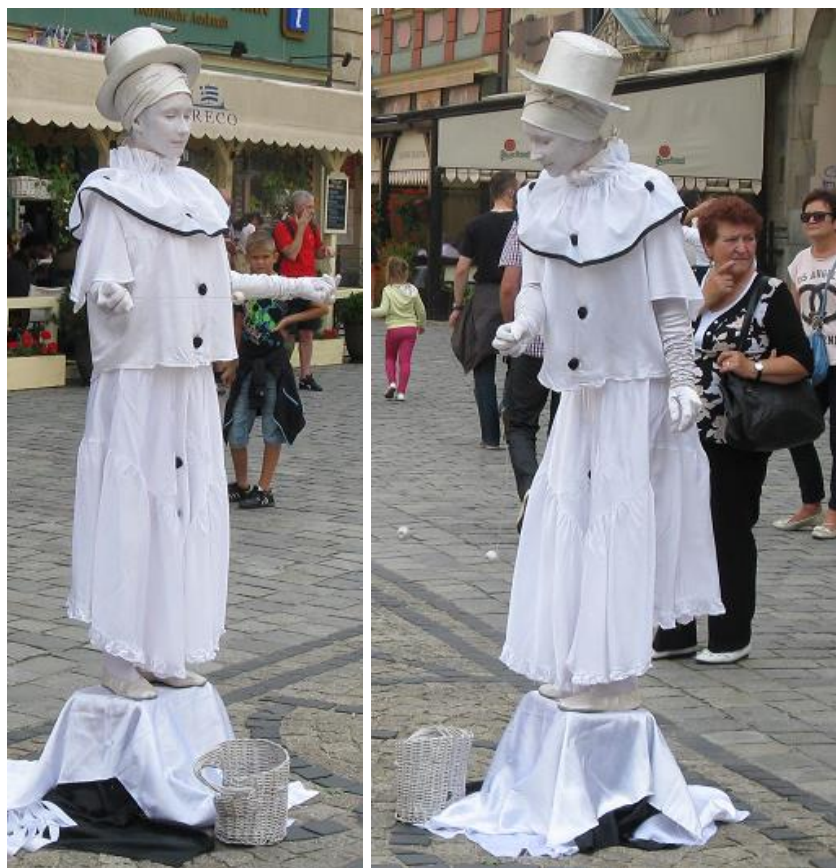
To też ozdoba naszego Rynku

Kiedy w dniu WOJSKA POLSKIEGO we Wrocławiu cywile zabawiali cywilów, to w Warszawie wojsko prezentowało swoją moc i wyposażenie – CYWILOM.