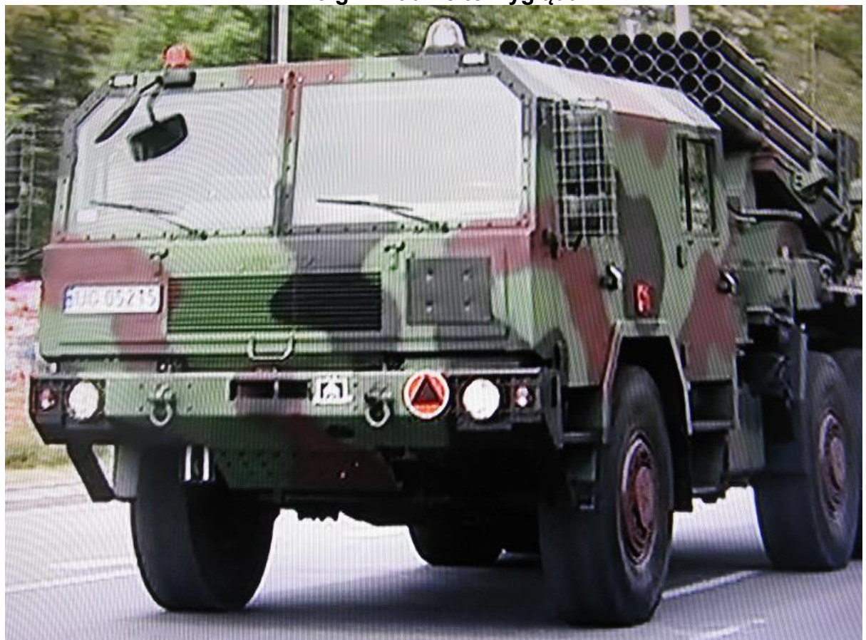
Czterdzieści luf... to nie żarty