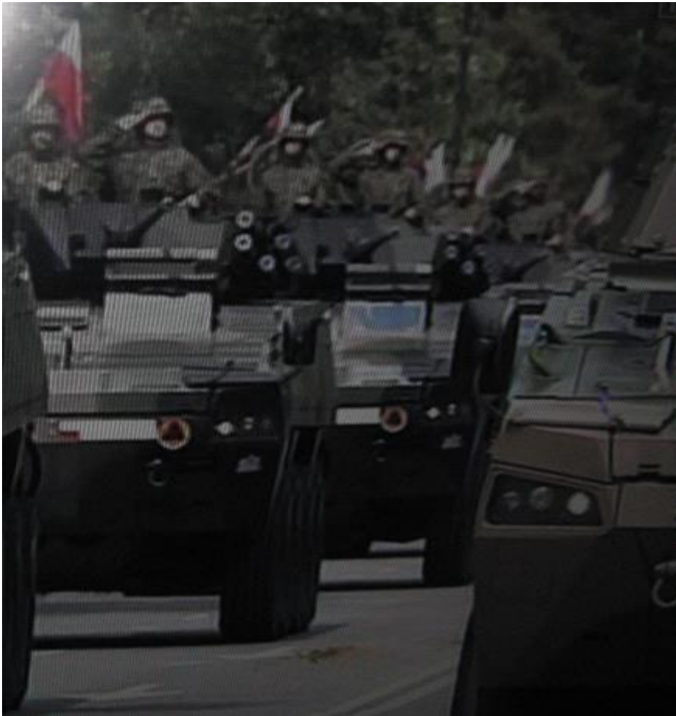
Transportery opancerzone na ulicach stolicy