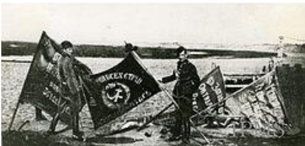
Zdobyte pod Warszawą sztandary bolszewików – sierpień 1920.

„Czechosłowacja, wykorzystując trudną sytuację polityczną Polski w latach 1919-1920, zajęła zbrojnie zamieszkałe przez polską większość Zaolzie. Odpowiadając na apel Kominternu, czescy kolejarze 12 maja 1920 roku zatrzymali w Brzeławiu francuskie transporty broni, a 6 lipca ogłosili strajk generalny na linii kolejowej Bogumin–Koszyce. Akcje strajkowe poparł rząd Czechosłowacji, ogłaszając 9 sierpnia 1920 roku ścisłą neutralność w wojnie polsko-sowieckiej. Licząc na upadek Polski, korzystne stosunki z Rosją sowiecką oraz utrzymanie zaanektowanego Zaolzia, 11 sierpnia władze czechosłowackie zablokowały jakkolwiek tranzyt materiałów wojennych z Zachodu (przede wszystkim z Francji) do Polski”.