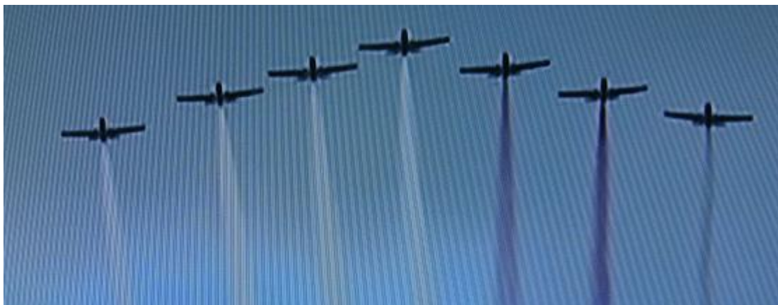
„BIAŁO-CZERWONA” nie tylko szachownica