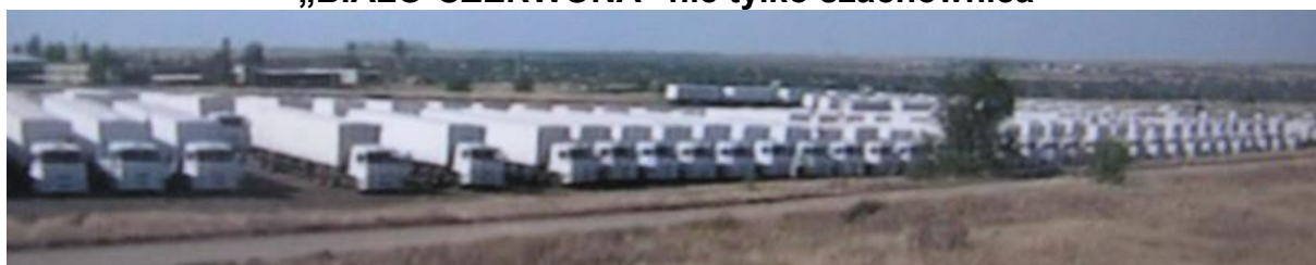
Pojazdy Armii Czerwonej przemalowane na biało stoją u „wrót Ukrainy” Nie wiadomo co jest w środku, a jeżeli pokazują to tylko np. 7/20 ton ładowności. Przyjaźń musi być otwarta..., bez względu na kraj