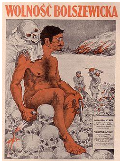
Polski plakat propagandowy, przedstawiający