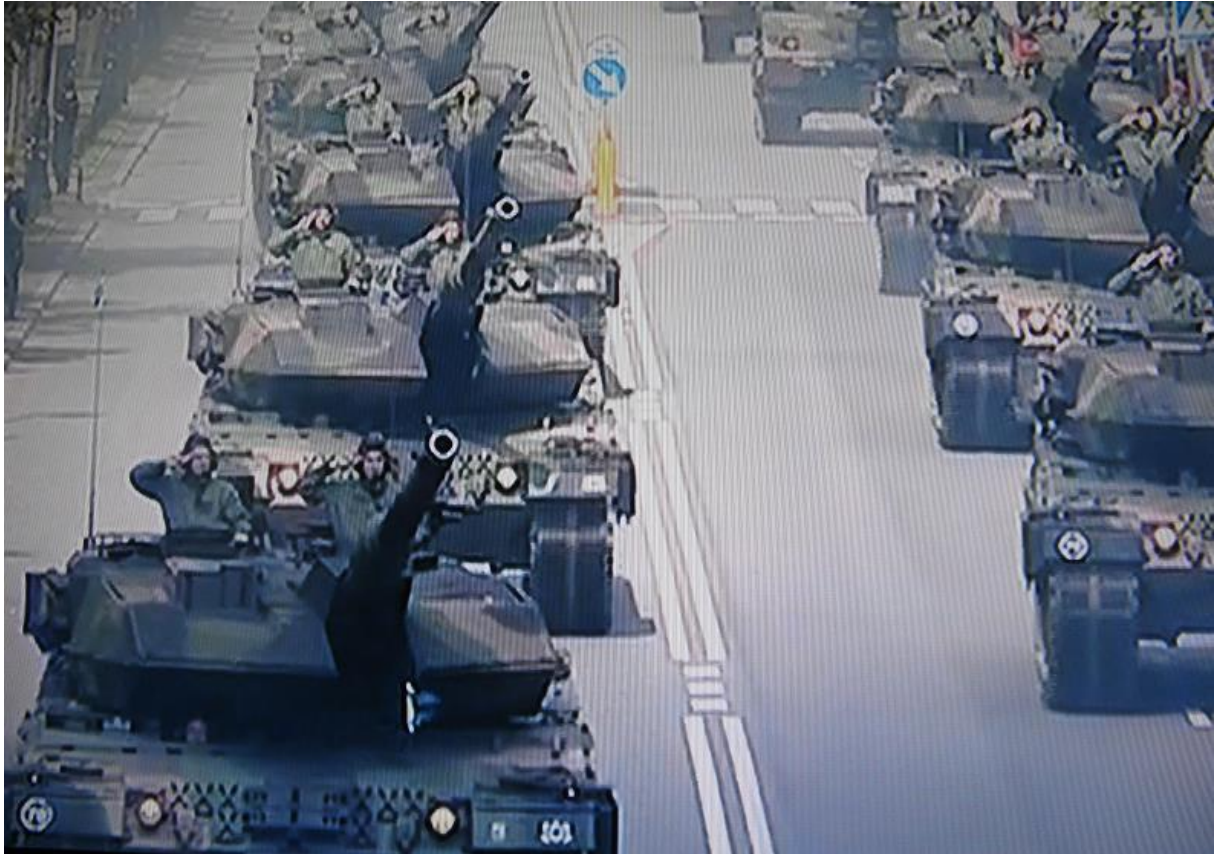
Czołgi ... ładnie to wygląda