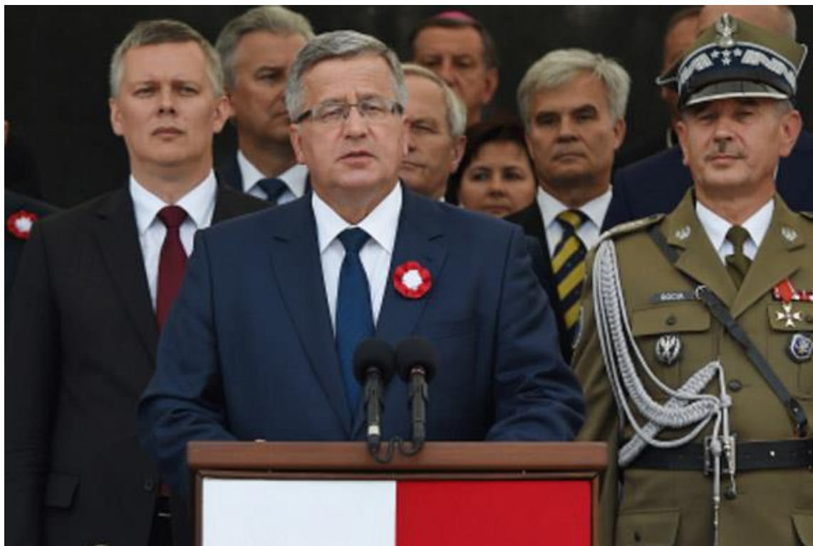
Przemawia Prezydent RP – p. Bronisław KOMOROWSKI

Kiedy w dniu WOJSKA POLSKIEGO we Wrocławiu cywile zabawiali cywilów, to w Warszawie wojsko prezentowało swoją moc i wyposażenie – CYWILOM.